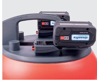
Einfaches Montieren/ Demontieren der Akkus