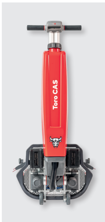
Cleanfix Toro CAS en position de transport